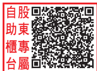
自股助東櫃專台屬